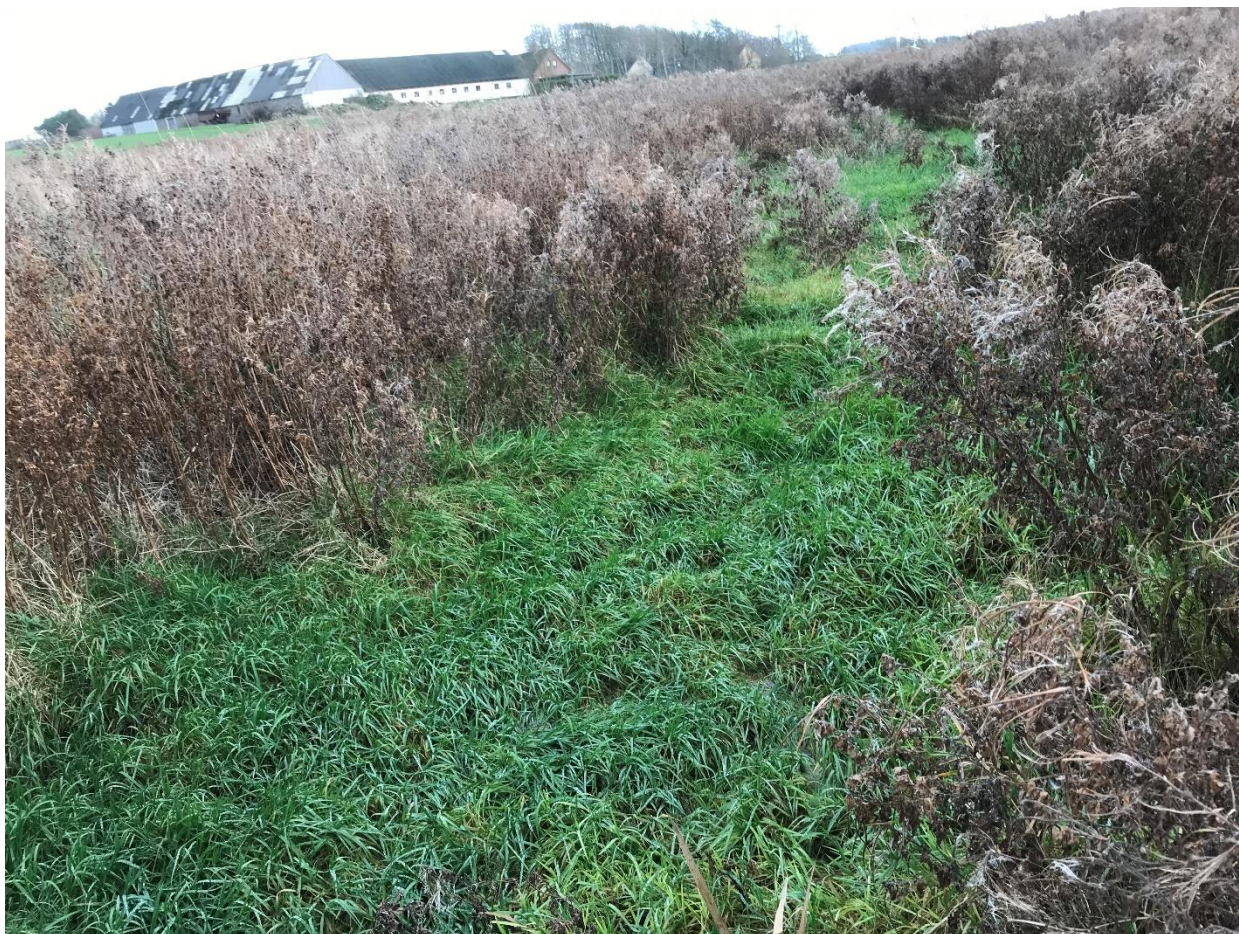
Figur 1 viser arealet som har karakter af bundløs grøft overgroet med mannasødgræs