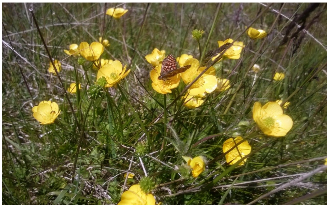
Hedepletvinge på knoldranunkel ved Bruså.