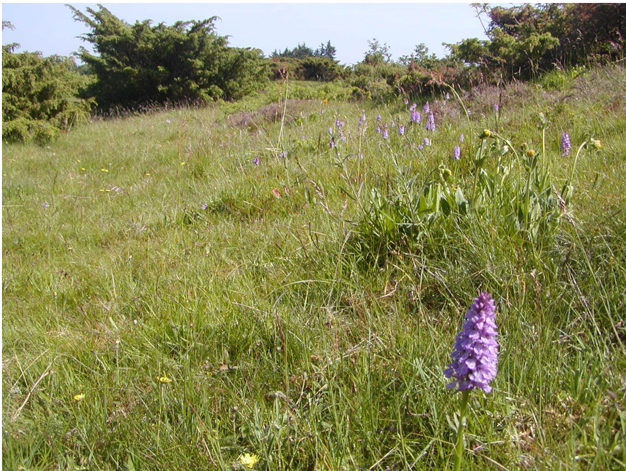
Overdrev med Plettet gøgeurt i Kyø Dale.

Da handleplanen ikke sætter nye rammer for fremtidige anlægstilladelser eller yderligere vil kunne påvirke internationalt udpegede naturbeskyttelsesområder væsentligt har kommunerne truffet afgørelse om, at der ikke er behov for en fornyet miljøvurdering.