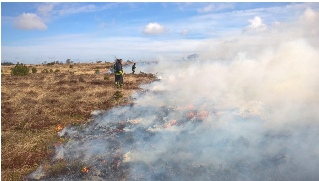
Afbrænding af Lundby hede.