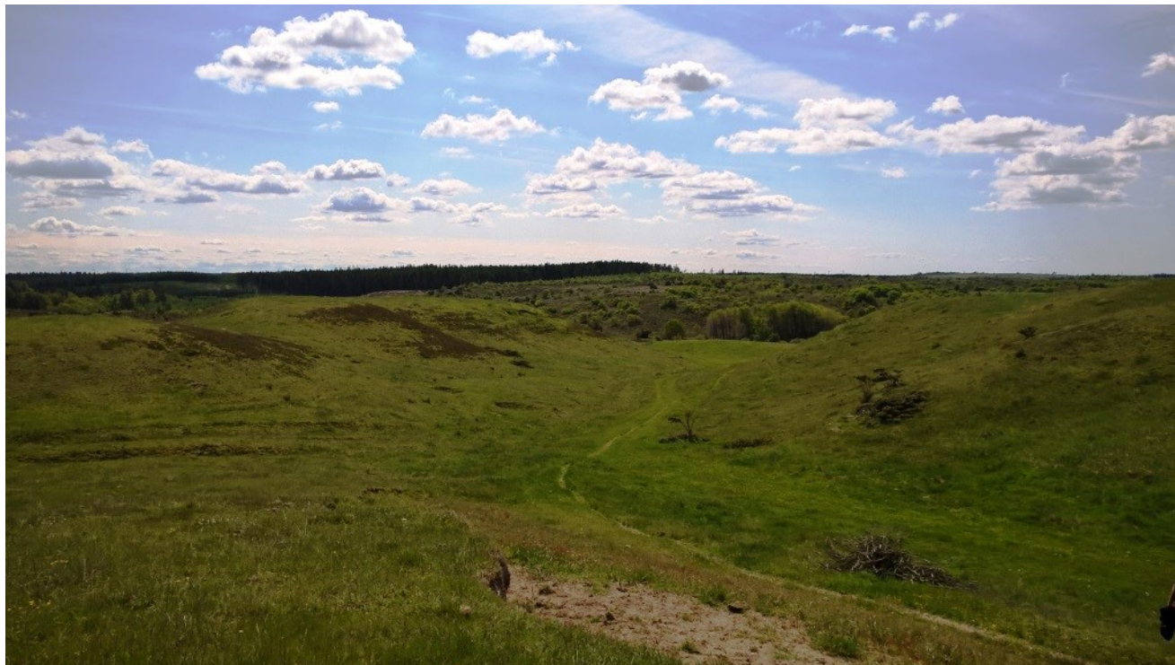
Udsigt fra Lundby Hede ned til Bruså, med udsigt mod Oudrup hede